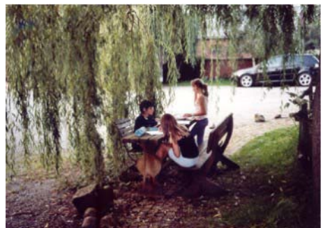
Im Schlosspark Neukirchen