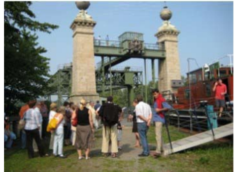
Das Schiffshebewerk Henrichenburg