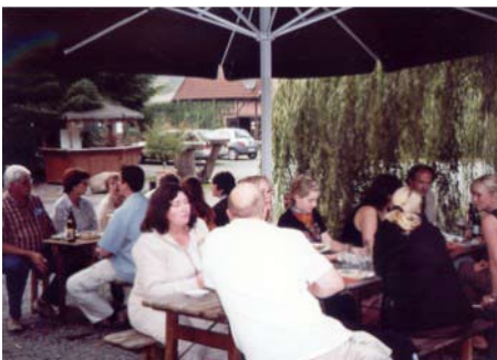
Ausklang auf dem Biohof Wewel