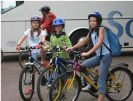
Start der Radfahrer