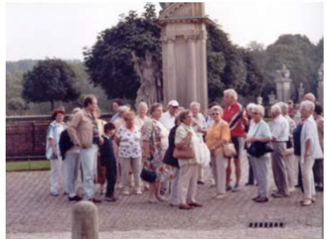
Im Schlosspark Nordkirchen